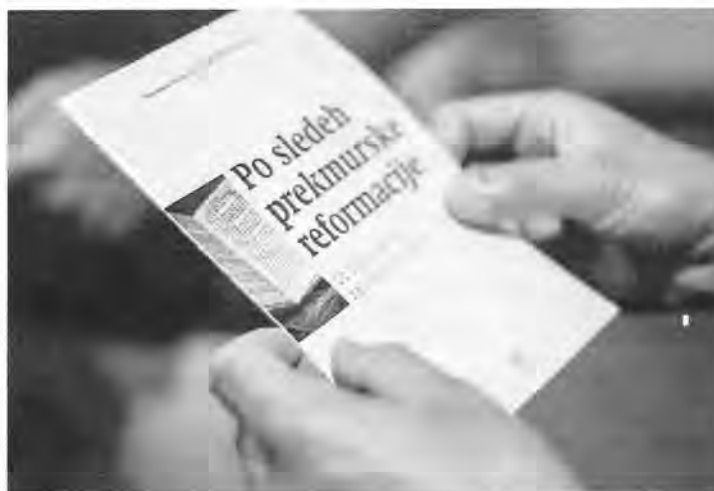
Slika 14: Zgibanka Po sledih prekmurske reformacije