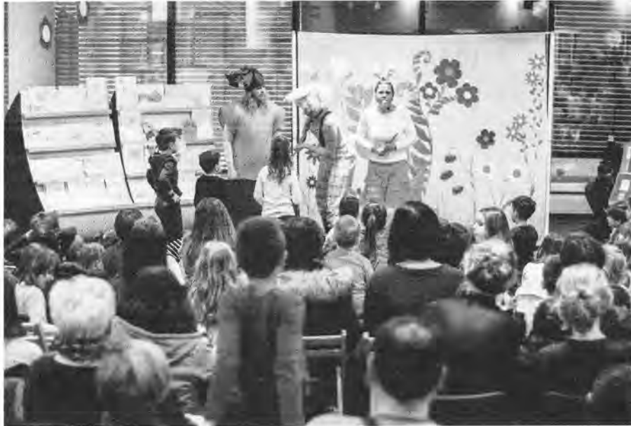
Slika 5: Zaključna prireditev bralne značke Jaz pa berem, 14. 02. 2017

so sklenili s predstavo Karlo Korenček, ki jo je pripravilo društvo Pisani mehurčki iz Murske Sobotе, in s podelitvijo majčk z napisom Jaz pa berem.