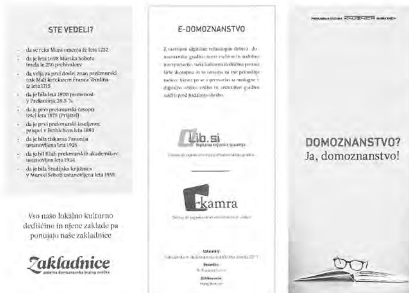
Slika 8: Del zloženke Domoznanstvo? Ja, domoznanstvo!

Tako smo poimenovali zgibanko o domoznanski dejavnosti, katere namen je bil približati domoznansko dejavnost našim uporabnikom in podati nekaj osnovnih informacij o tej dejavnosti, kot so domoznanstvo, domoznanska zbirka, domoznanski oddelek in e-domoznanstvo.