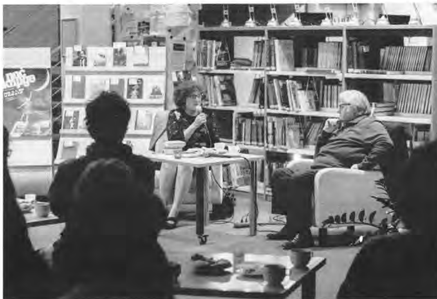
Slika 6: Literarni večer s Tonetom Partljičem v sklopu projekta Noč knjige, 18. 04. 2017