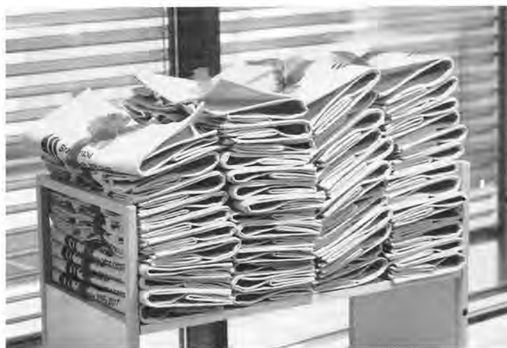
Slika 1: Darilne vrečke ob zaključku bralne značke v sezoni 2016/2017