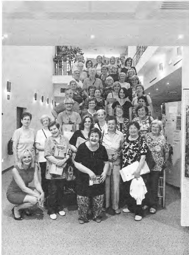
Slika 2: Skupinska slika z zaključka bralne značke