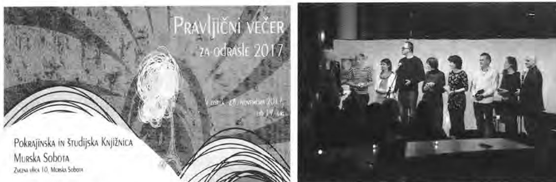
Slika 4: Vabilo na pravljíčni večer in skupinska slika pravljíčarjev na prireditvi, 28. 11. 2017