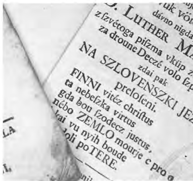
Slika 7: Naslovnica zbornika