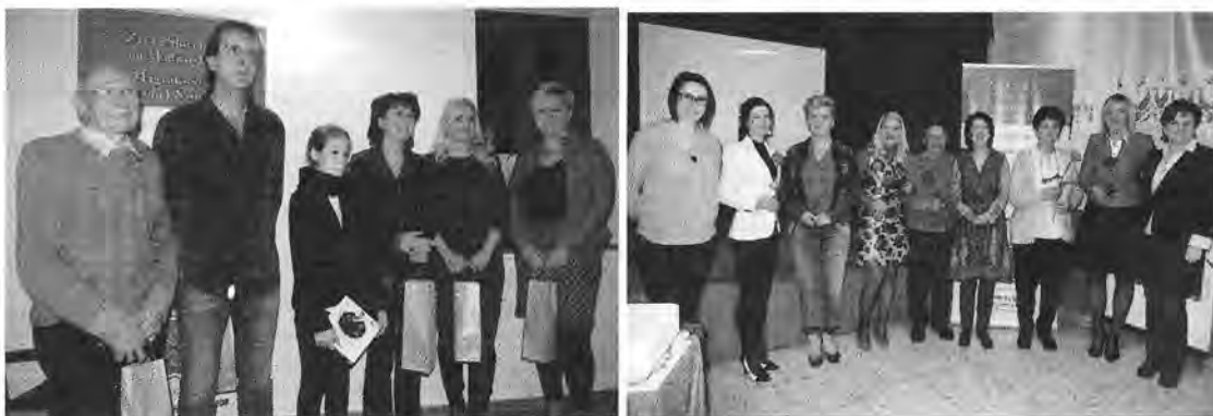
Slika 10: Utrinka iz pravljīčnih večerov v Porabju, levo z Gornjega Senika, desno s Števanovcev.

Pri izvedbi projekta je kot partner sodelovala Zveza Slovencev na Madžarskem s sedežem v Monoštru, ki se upošteva kot osrednja knjižnica Slovencev v zamejstvu, kajti osrednje knjižnice Slovencev na Madžarskem ni. S projektom bomo seveda nadaljevali naprej.