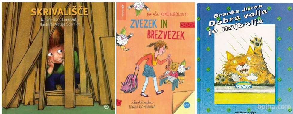
C JURCA, B.: Dobra volja je najbolja

B C KONC LORENZUTTI, N.: Skrivališče / Zvezek in brezvezek