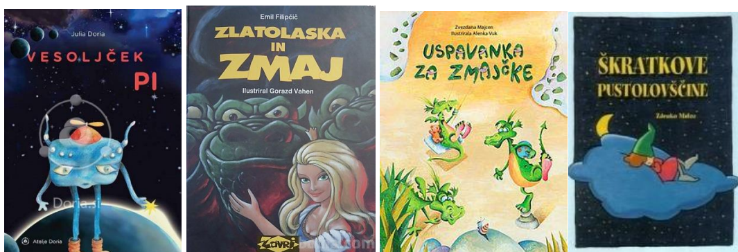
Z C MAJHEN, Z.: Uspavanka za zmajčke / Z C MATOZ, Z.: Škratkovje pustolovščine

C DORIA, J.: Vesoljček Pi / ZC FILIPČIČ, E.: Zlatolaska in zmaj